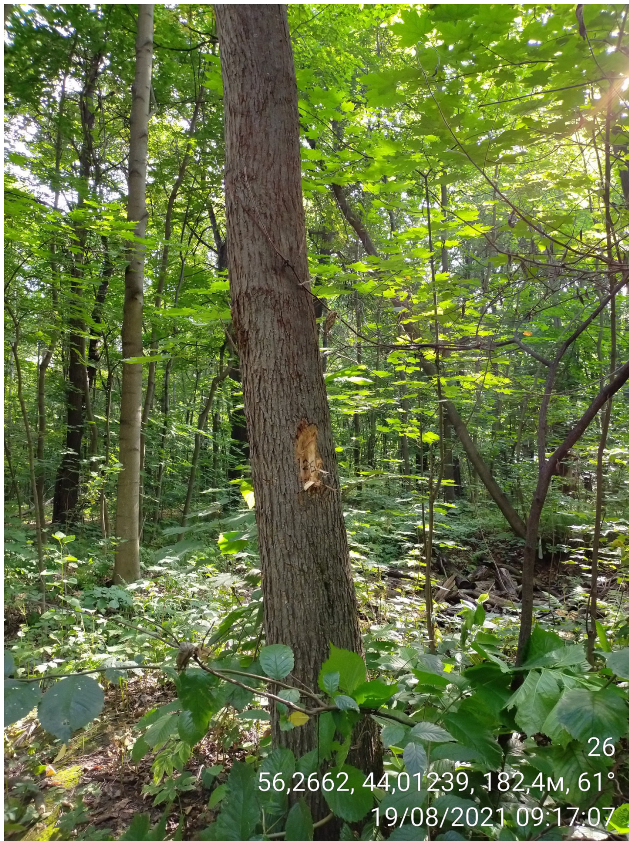
Дерево № 26